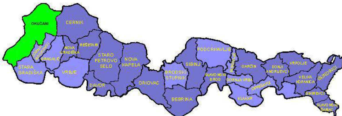
Grafički prikaz područja Općine Okučani unutar granica Brodsko posavske županije

Područje općine prostire se na 159,31 km 2 i obuhvaća 17 naselja: Benkovac, Bijela Stijena, Bobare, Bodegraj, Cage, Čaprginci, Čovac, Donji Rogolji, Gornji Rogolji, Lađevac, Lještani, Mašićka Šagovina, Okučani, Širinci, Trnakovac, Vrbovljani i Žumberkovac.