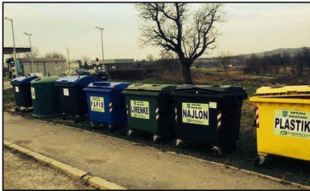
Slika 1; Zeleni otoci na području Općine

Mjere odvojenog sakupljanja otpada na području Općine Okučani provode se putem 15 zelenih otoka. Na području naselja Okučani, kao administrativnog središta općine i naselja s najvećim brojem stanovnika, postavljeni su spremnici za papir, staklo, PET ambalažu, najlon, baterije, lijekove, a uskoro će biti omogućeno odlaganje stiropora i tekstila. Na području ostalih naselja postavljeni su spremnici